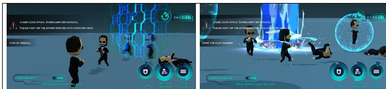
Fig 2. 模擬防火牆及流量沖洗之遊戲畫面

遊戲以 3D 方式模擬病毒感染和控制電腦的過程。並逐步增加被控制電腦的數量，形成殭屍軍團規模。並且殭屍軍團可以選擇不同類型的目標，如網站服務器、遊戲服務器等進行大規模攻擊（訪問），直觀展示對服務器造成的衝擊效果。玩家可通過視覺化，進行直觀的防火牆設置，以防禦盾牌的形象展現 DDoS 緩解服務的保護作用，採用隔離屏障及高壓水槍的形象，模擬清洗攻擊流量的過程，如 Fig 2 所示。關卡中攻擊的類型和強度將不斷變化，考驗玩家靈活應對的能力。根據防禦效果的好壞，將獲得不同的分數和評級，通關後可解鎖新的防禦裝備和場景。透過簡單有趣的攻防操作方式，玩家可以在遊戲中親自體驗應對 DDoS 攻擊的過程，了解多種防禦策略的原理，提高網絡安全意識和防護能力。透過好奇心的驅使，啟發式地學習網路安全的攻防基礎知識。